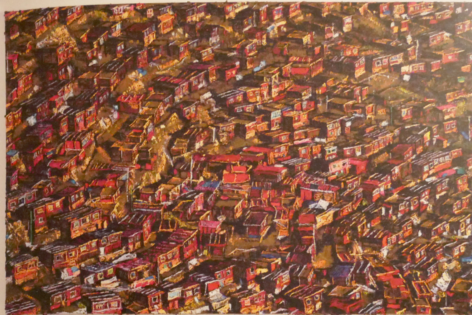
BARANYAI LEVENTE: Red Tibet, 2020, olaj, vászon, 96x145 cm

A városaidat, városképeidet jellemző „csiszolt kövek, fémek és szénhidrogének szokatlan koncentrációja, ha nem is