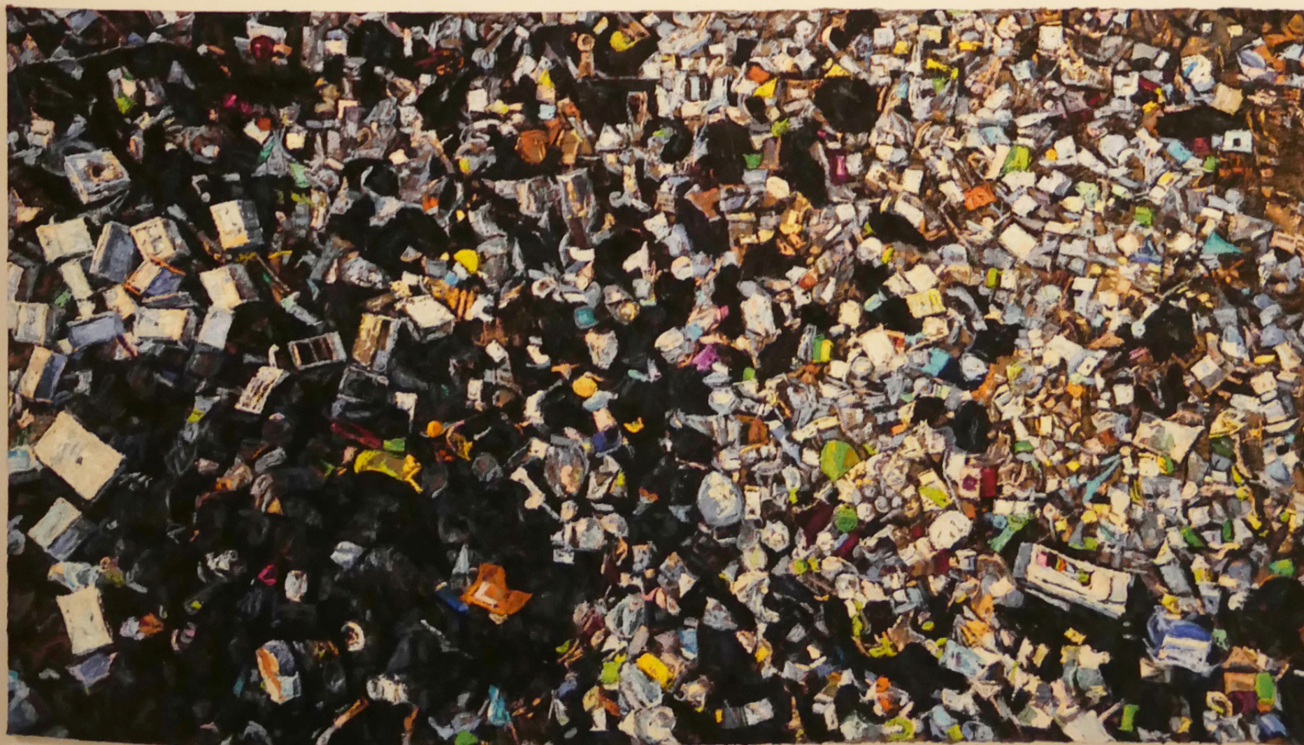
BARANYAI LEVENTE: Plasztikhorrör, 2020, olaj, vászon, 120x214 cm A művész jóvoltából